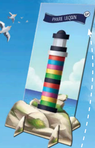
Kortelės viršuje esantis skaičius nurodo iš kiek detalių sudarytas švyturys.